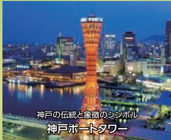
神戸の伝統と象徴のシンボル 神戸ポートタワー

神戸の中心 三宮は、神戸市営地下鉄、阪神電鉄本線(山陽電鉄乗入)、阪急神戸線などの駅が集まる交通の要衝。神戸市の郊外部やポートアイランドの住宅地から三宮周辺のオフィスへ通勤する人も多く、職住商近接の住宅エリアとしても人気が高まっています。また、神戸北野異人館や有馬温泉など観光スポットとしても人気を集めています。