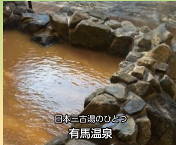
日本三古湯のひとつ 有馬温泉