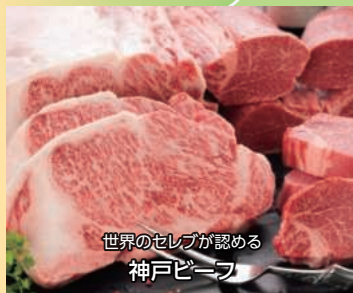
世界のセレブが認める 神戸ビーフ