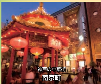
神戸の中華街 南京町