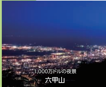
1,000万ドルの夜景 六甲山