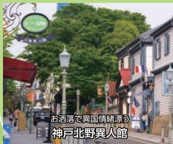
お洒落で異国情緒漂う 神戸北野異人館