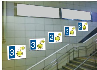
3 エスカレーター横壁面連貼セット (4「エスカレーター横壁面」も同じ場所となります)