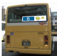
6 後部帯ステッカー