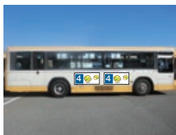
4 外側ステッカー (小)