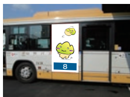
8 戸袋縦型ステッカー