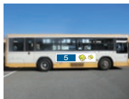
5 外側ステッカー (大)