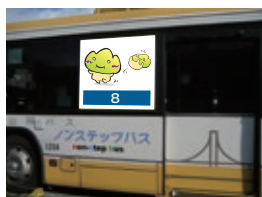
8 戸袋大型ステッカー